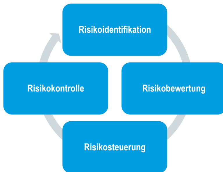
Abb 13 – Risikomanagementprozess

Das Risikomanagementsystem ist ein wesentlicher Teil des Governance-Systems der Barmenia. Eine Komponente des Risikomanagementsystems stellt der Risikomanagementprozess dar. Dieser ist in dem folgenden Schaubild dargestellt.